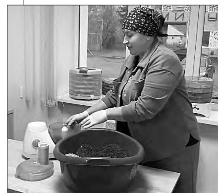
Добірку підготувала наш власкор на Рівненщині Олександра ЮРКОВА.

Бугринська. Працівниці апарату сільської ради готують смачний сухий борщ для захисників на передову (на знімку). Порція запашного, поживного, ароматного та приготовленого з любов'ю і турботою борщу додасть нашим воїнам не лише сили, зігріє в холоди, а й поліпшить настрої, вважають бугринські господині.