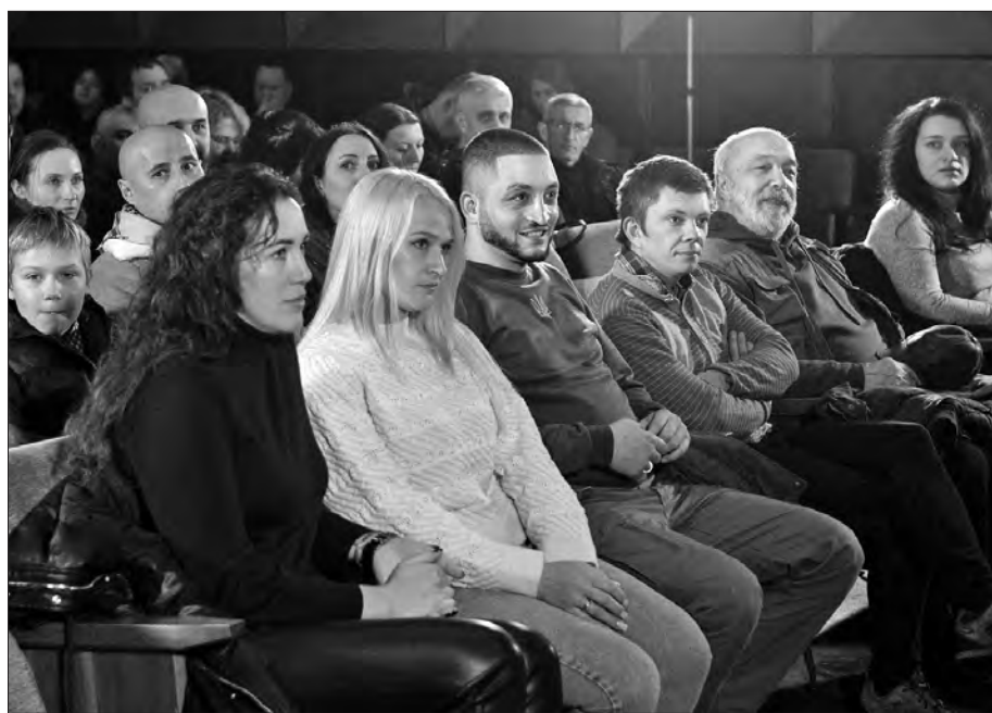
Під час прем'єри фільму.

У стрічці 26-річний командир навчає підлеглих копати шанці та облаштовувати бліндажі. Роздає інструкції та на горіхи не тільки зеленим, а й вовічі старшим бійцям. Хтось із героїв зауважує, що фортифікацію будують за кошти волонтерів. Перші БПЛА сюди привезли теж вони, хоча тоді мало хто міг передбачити, що сучасні війни називатимуть «дроновими».