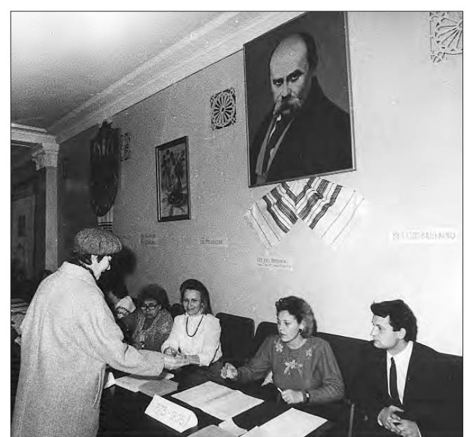
1 грудня 1991 року. Луцьк. Голосування на Всеукраїнському референдумі та виборах Президента.

Загалом участь у голосуванні взяли 31 891 742 особи — 84,18% населення України. Референдум відбувся в усіх 27 адміністративних регіонах України: 24 областях, Автономній республіці Крим, Києві та Севастополі. У Києві незалежність підтримали 92,88 відсотка виборців, у Донецькій області — 83,9%, у Луганській — 83,86%. А в Автономній Республіці Крим незалежності сказали «так» 54,19% виборців, тоді як у Севастополі показник був вищим — 57,07%. Лише після 1 грудня 1991 року Україну почали визнавати інші країни.