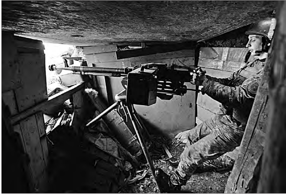
На позиції «Зеніт» біля Донецького аеропорту 22 травня 2017 року.